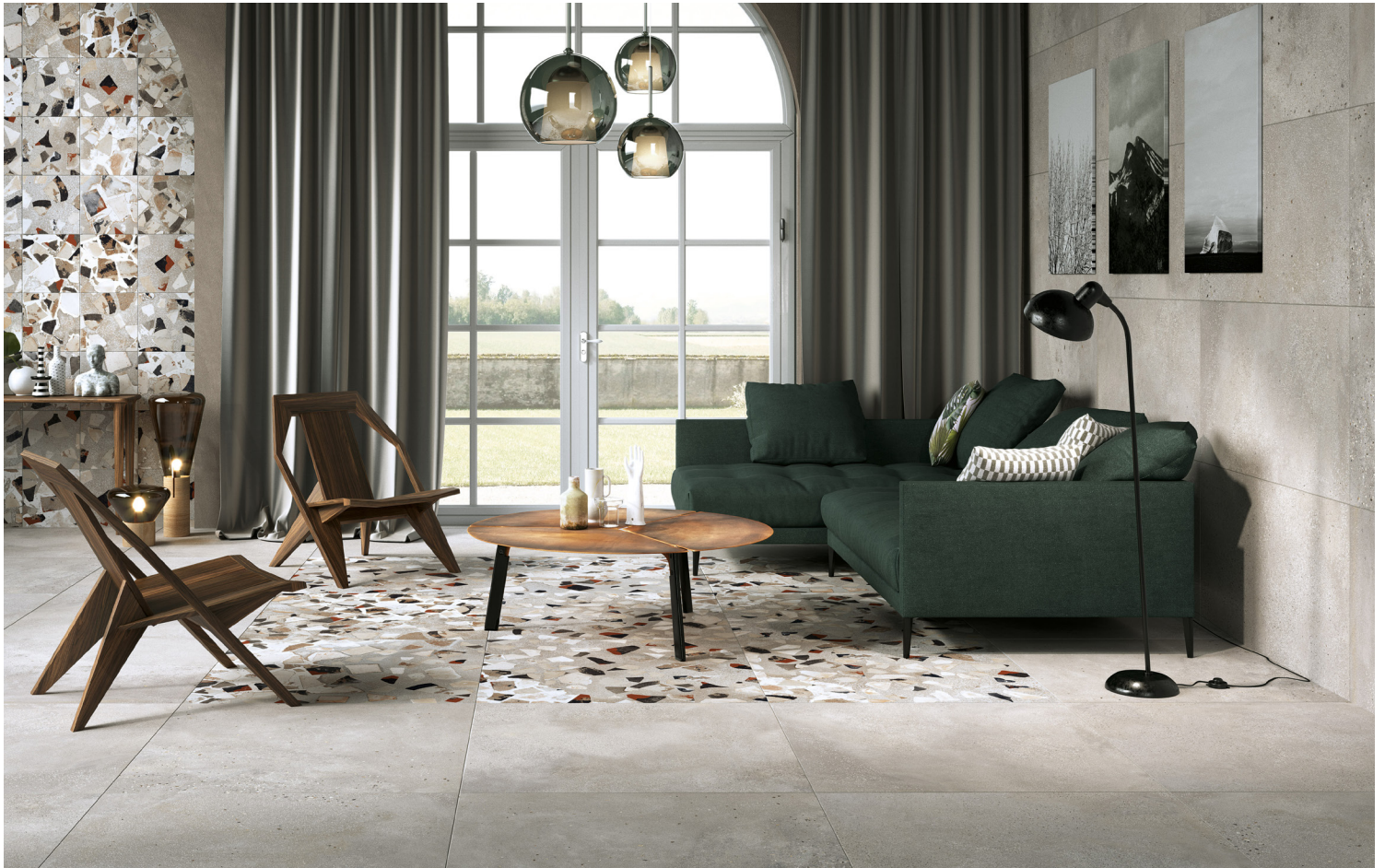
CENERE (GRIS) & DÉCOR CENERE (GRIS)