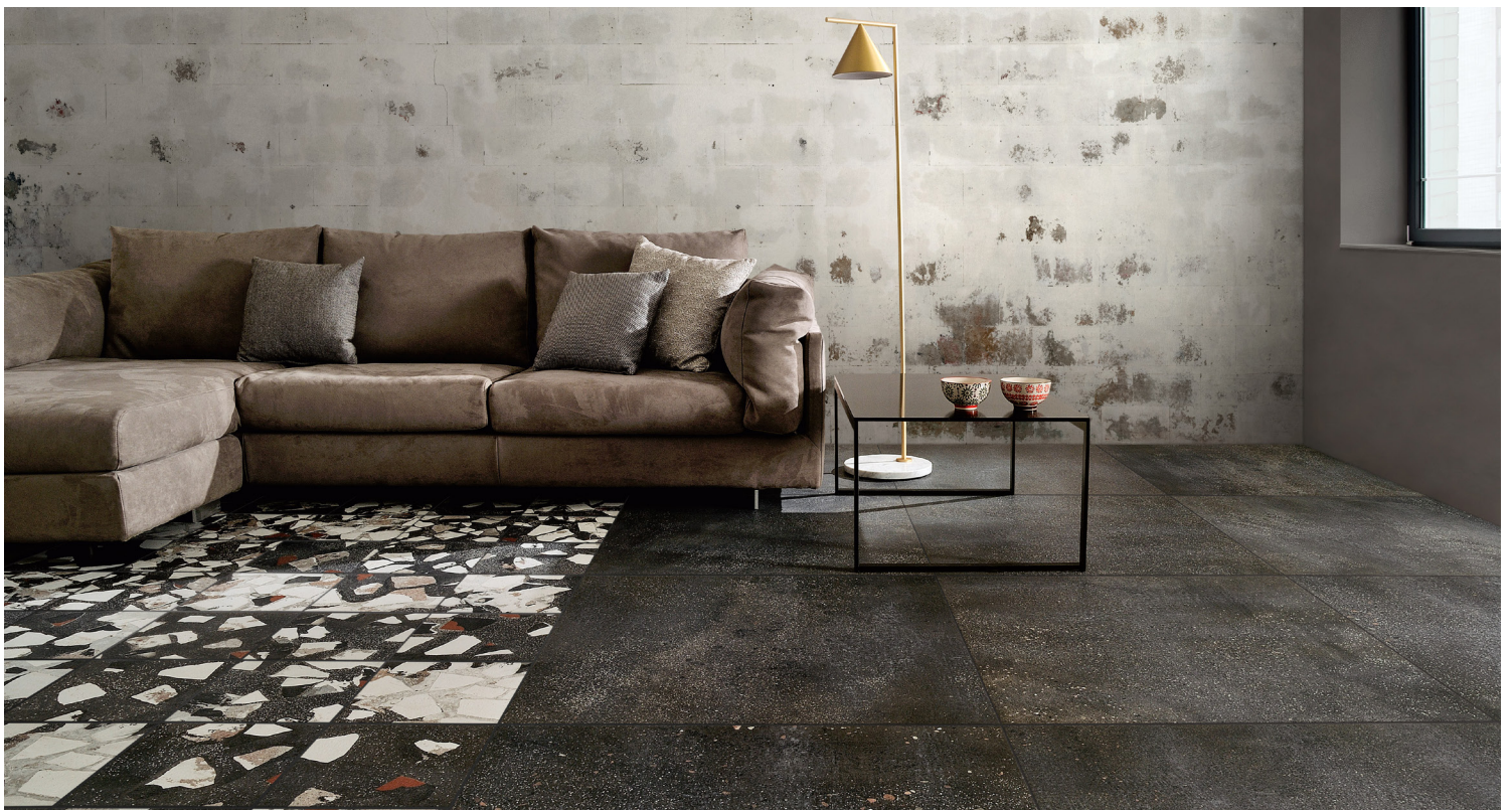
GRAFITE (NOIR) & DÉCOR GRAFITE (NOIR)